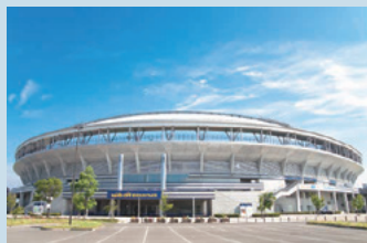
広域スタジアム監視