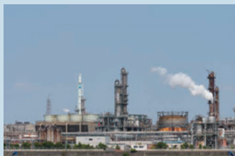
工場広域施設監視