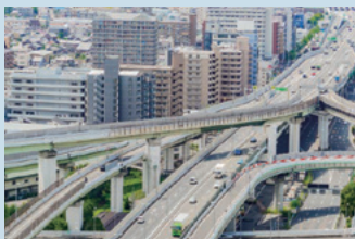
高速道路災害時点検